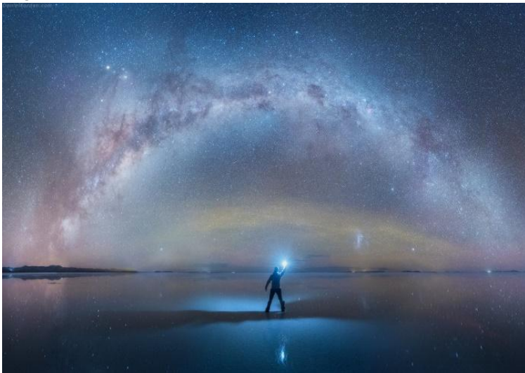
Figure 3 : Source : http://www.diazmag.com/les-photographies-celestes-de-la-voie-lactee-sur-le-salar-de-uyuni-en-bolivie/

Pour soigner il faut avoir soi-même suffisamment d'énergie, être en bonne santé, se régénérer !